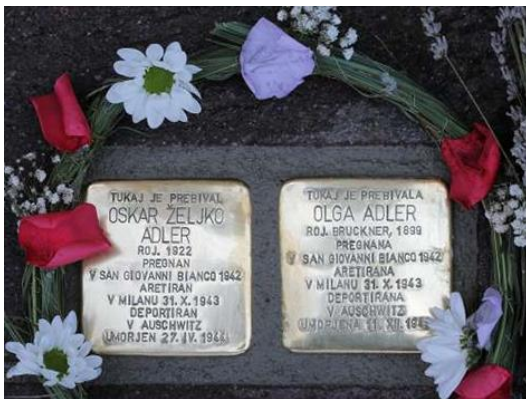
Slika: Tlakovci spomina zdaj tudi v Ljubljani.

Ljubljana je drugo slovensko mesto, vključeno v projekt, saj so prve tlakovce spomina na pločnik pred stavbami leta 2012 postavili v Mariboru. V Ljubljani so v ponedeljek skupno postavili 23 teh kamnitih kock, velikih deset krat deset centimetrov z medeninasto ploščico, na kateri so vklesani osebni podatki žrtve nacizma. Tukaj je prebival oz. Tukaj je prebivala se začne zapis.