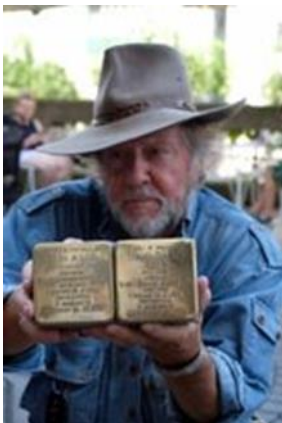
Slika: Gunter Demnig drži obeležja v spomin slovenskim Judom.

Spotikavce, gre za kamnite tlakovce, prevlečene s slojem medenine z imeni žrtev, je začel leta 1992 pred stavbami z zadnjim znanim naslovom žrtev postavljati umetnik Gunter Demnig . Prve je postavil v Nemčiji, od takrat pa so spotikavce, skupno že več kot 60.000, postavili v več kot 610 mestih v 22 državah, poleg Nemčije tudi v Avstriji, na Madžarskem, Nizozemskem, v Belgiji, na Češkem, Norveškem in Ukrajini. Spotikavci veljajo za največji decentralizirani spomenik žrtvam na svetu.