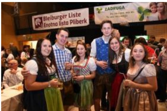
Slika: Kmečki ples Skupnosti južnokoroških kmetov in kmetov. Foto: Novice

http://www.novice.at/novice/zabava/zabava-do-jutranjih-ur/