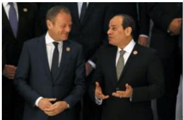
Slika: Sopredsedujoča vrhu, Donald Tusk in Abdel Fatah Al Sisi.

Strokovnjaki ob tem opozarjajo, da je pomen vrha simboličen. "V zadnjih 20 letih noben izmed teh vrhov ali konferenc ni vodil do kakšnih resnih rezultatov," za Al Džaziro pravi profesor politike na Bližnjem vzhodu Mahdžub Zveiri. Za zdaj še ni jasno, ali bo voditeljem uspelo sprejeti skupno izjavo. "Vrh je preprosto prevelik, da bi se udeleženci lahko strinjali glede obravnavanih tematik," izpostavlja sirski pisatelj in raziskovalec pri arabskem centru za raziskave in politične študije Marvan Kaban.