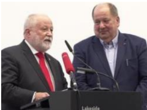
Slika: Minister RS za Slovence v zamejstvu in po svetu Peter Jožef Česnik je na začetku občnega zbora izrazil dosedanjemu predsedniku Marjanu Sturmju zahvalo in spoštovanje.

Bil je minister Česnik, ki je na začetku občnega zbora izrazil dosedanjemu predsedniku Marjanu Sturmju zahvalo in spoštovanje - nanašajoč se na zatrditev v Sturmovem pogovoru za tednik Novice, da ostaja „homo politicus“.