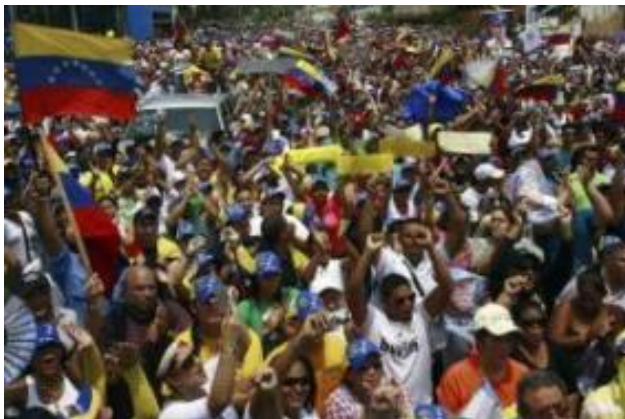
Slika: Madžarska konservativna vlada premierja Viktorja Orbana je sprejela 300 beguncev iz Venezuele.

Madžarska konservativna vlada premierja Viktorja Orbana je sprejela 300 beguncev iz Venezuele, je včeraj poročal portal Index.hu. Opozicija je že kritizirala to dejanje vlade, ki je bilo izvedeno v tajnosti in očitno že lani in očitno tudi ni bila organizirana iz Bruslja, kot je to trdil Orban, ampak iz Budimpešte.