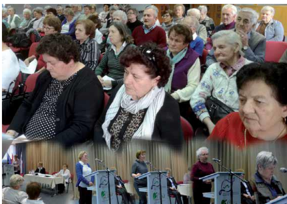
Slika: Društvo porabski slovenski penzionistov.

Društvo porabski slovenski penzionistov je občni zbor melo 15. februara, prišlo nas je 78, tau je 80 % članstva. Kak predsednica društva sem etak poročala o lanskem delu: »Gda vküp postavlamo delo, programe za cejlo leto, furt pred očami moramo meti, kakšen cilj mámo pa ka željimo dosegniti s tistim, ka mamó v svojom rendelüvanji, statuti/alapszabályi.