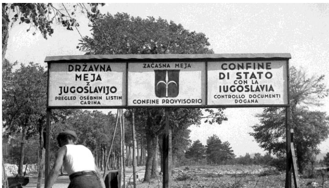
Slika: Začasna državna meja med Jugoslavijo in Italijo – postavljanje mejne table v Lokvi, september 1947.

https://www.rtv slo.si/zidovi/pricevanja/postaviti-mejo-in-deliti-ozemlje-je-tragedija/480841