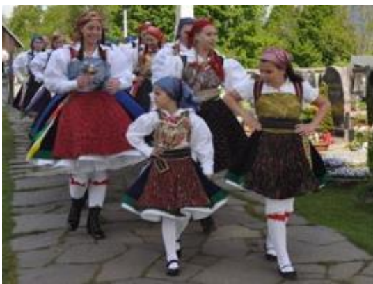
Slika: Avstrijska komisija Unesca je zapisala v avstrijski seznam nesnovne dediščine dvojezični naslov „Untergailtaler Kirchtagsbräuche und Untergailtaler Tracht/ Ziljski žegen in ziljska noša“.

Uspeh zavezuje, se zaveda zgodovinar Peter Wiesflecker.