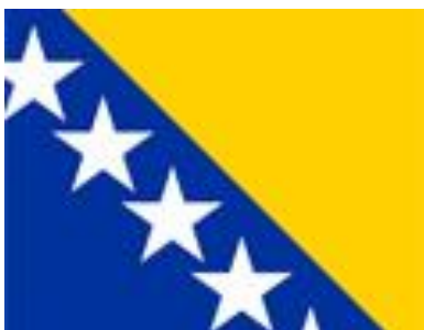
Slika: Predsedujoči svetu ministrov Bosne in Hercegovine (BiH) Denis Zvizdić je v ponedeljek potrdil, da je država izpolnila vse uradne pogoje za pridobitev statusa kandidatke za članstvo v Evropski uniji.

Zvizdić je dejal, da so izpolnjeni vsi uradni pogoji za pripravo mnenja o zahtevi BiH za članstvo v EU in pridobitev statusa kandidatke, poroča hrvaška tiskovna agencija Hina. Kot je dodal, je svet ministrov na izredni seji v nedeljo formalno potrdili vse odgovore na dodatna vprašanja Evropske komisije. Bruselj so najbolj zanimali dodatni odgovori na vprašanja o političnih kriterijih, ki jih je bilo 106 izmed vseh 655 dodatnih vprašanj.