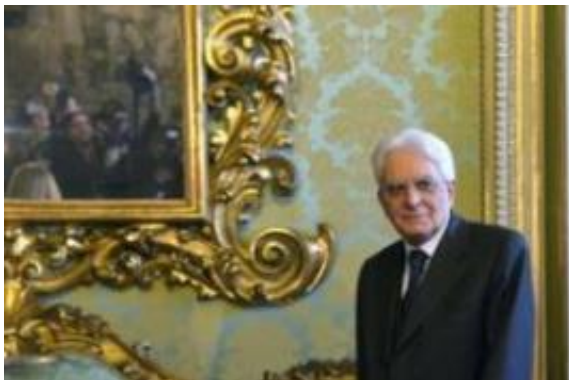
Govor Mattarelle je odzvanjal znano govorico o Italijanih kot žrtvah barbarstva Slovencev in Hrvatov.

Zdajšnje zaostrovanje je pomenljivo, prihaja iz ust vladnih politikov, toda ne samo od njih. Italija je formalno zaprosila Francijo za ekstradicijo nekdanjega člana oborožene levičarske skupine, dejavne v »svinčenih letih« terorizma, od poznih šestdesetih do zgodnjih osemdesetih preteklega stoletja. Z zahtevo je poglobila konflikt z uradnim Parizom počasem odpoklicu francoskega veleposlanika iz Rima. V istem času je predsednik evropskega parlamenta Antonio Tajani ob »dnevu spomina« v Bazovici vzklikal »italijanski Istri in Dalmaciji«, medtem ko je notranji minister žrtve fojbe primerjal s holokavstom in Auschwitzem. Matteo Salvini je enfant terrible italijanske politike, ime si je zgradil s sovražnostjo do migrantov, on vselej najde sovražnika. Njegovo ponarejanje zgodovine na vzhodni meji, vključno s primerjanjem trpljenja Italijanov s trpljenjem Judov, ni posebno presenetilo. Podobno kot je Jadran vselej bil za Italijo mare nostrum , skrajna desnica dojema slovenski in hrvaški prostor kot »lovišče«. Tajani pa, čeprav na visokem položaju, ne velja za politika visokega ranga, vedno je bil in ostaja Berlusconijev šerpa.