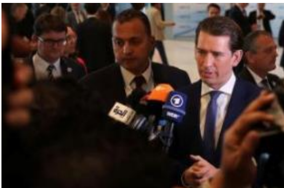
Slika: Kurz poziva h krepitvi pritiska na severnoafriške države.

Kurz zahteva okrepljeno sprejemanje vrnjenih migrantov