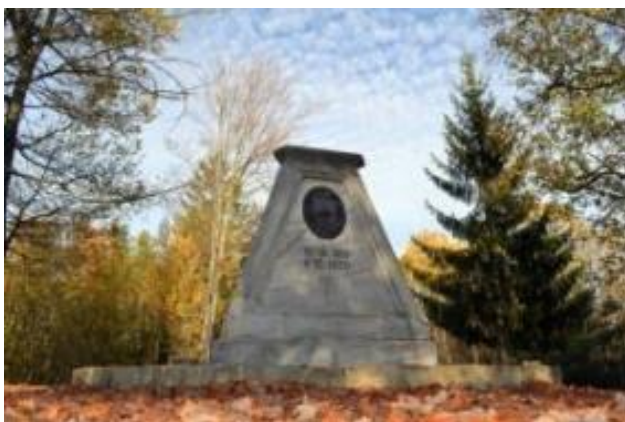
Slika: Tromejni kamen, postavljen leta 1924.

Vsakoletna tradicionalna srečanja treh narodov na stičišču treh držav Avstrije, Slovenije in Madžarske.