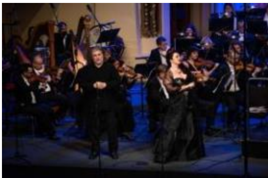
Slika: Fantastičen koncert opernih arij tenorja in dirigenta Jose Cure v ljubljanskem Unionu.