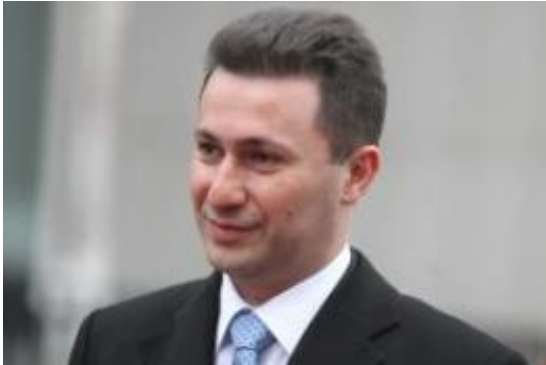
Slika: Nikola Gruevski, bivši premier in vodja stranke VMRO-DPMNE, ostaja na Madžarskem, kamor je pobegnil pred roko pravice.

Severno Makedonijo poleg zahtevanih in nujno potrebnih reform čaka tudi sodni obračun z grehi in grešniki iz preteklosti, a proces ne bo hiter in lahek, saj iz omar padajo novi okostnjaki.