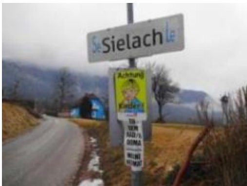
Slika: Kukovičeve nalepke, ki so vznemirile avstrijske oblasti.