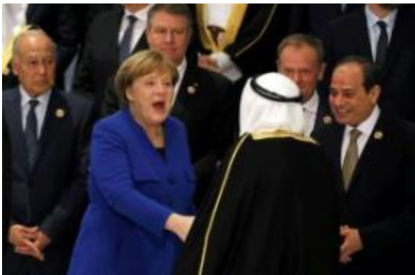
Slika: Angela Merkel ob srečanju s kuvajtskim emirjem Sabahom Al Ahmadom Al Džaberjem Al Sabahom.

Na prvem vrhu članic Evropske unije in Arabske lige so voditelji pozvali h krepitvi sodelovanja. Predsednik Evropskega sveta Donald Tusk je izpostavil skupne izzive. Egipčanski predsednik Abdel Fatah Al Sisi je pozval k boju proti terorizmu. "S sosedi sta vedno dva načina obstoja: sodelovanje ali konflikt. Mi smo se odločili za sodelovanje," je dejal Tusk v uvodnem nagovoru vrha v Šarm el Šejku v Egiptu in poudaril, da je treba sodelovanje krepiti, saj bodo imeli od tega največ državljani. Med skupnimi izzivi je izpostavil okoljske spremembe, zmanjševanje brezposelnosti in krepitev gospodarskega sodelovanja. Gostitelj vrha, egipčanski predsednik Al Sisi, je v uvodnem nagovoru Evropsko unijo pozval k okrepitvi skupnega boja proti terorizmu. Egipt se že leta bori proti terorizmu, najhuje je predvsem na severu polotoka Sinaj. Predsednik Evropske komisije Jean-Claude Juncker je pred vrhom dejal, da je to zelo pomembno srečanje, ki nosi pomembno sporočilo svetu, je pa opomnil, da ga skrbi stanje človekovih pravic v več arabskih državah.