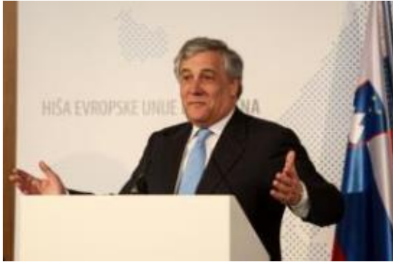
Slika: Antonio Tajani.

Asimilacijski pritiski na ta prostor so bili že tedaj tako siloviti, da se je obnje na koncu 19. stoletja javno spotaknil celo tržaški škof mons. Juraj Dobrila s svojim vizionarskim opozorilom, da se bodo nekega dne »Slovani v Istri dvignili na način, ki ne bo ugoden za Italijane«. Kar se je med drugo svetovno vojno tudi zgodilo, zlasti spričo brutalnih pritiskov fašizma, ki so pogнали v svet okrog 120.000 Slovencev in Hrvatov, in prispevalo k povojnemu eksodusu. Vmes si je Italija priključila še Ljubljansko pokrajino in tudi tam začela izvajati »etnično melioracijo«.