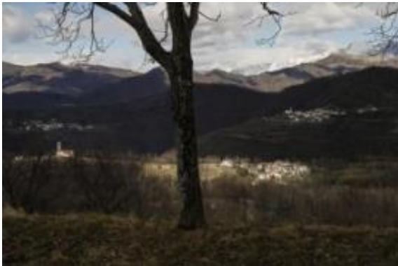
Slika: Panoramski pogled iz Spodnjega Tarbija na vasi Črnetiči in Oblica. Benečija ima velik turistični potencial.

V desetih некоč povsem slovenskih občinah zdaj živi samo še 7556 ljudi.