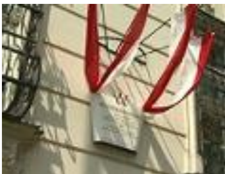
Slika: Narodni svet koroških Slovencev (NSKS) na svoji spletni strani objavlja pismo ministrstva za EU, umetnost, kulturo in medije, ki razpisuje natečaj za inovativne pobude za poučevanje in učenje jezikov, ki so trajnostne in določajo smer.

Decembra letos bo minilo 20 let, odkar je Dvojezična zvezna trgovska akademija (DTAK) v Celovcu leta 1999 prejela evropski pečat za inovativne jezikovne projekte. Leto navrh ga je prejela še Slovenska gimnazija v Celovcu za štirijezični Kugijev razred. Danes je na seznamu prejemnikov tega odličja kar nekaj izobraževalnih ustanov.