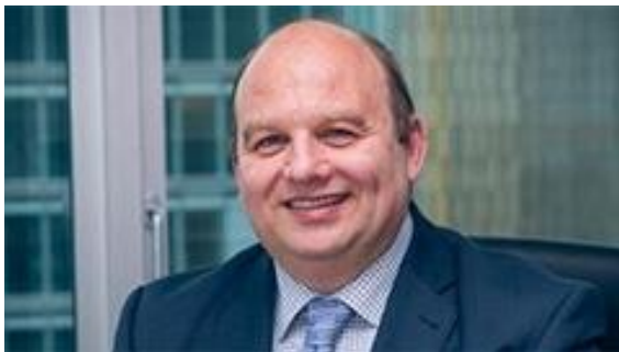
Slika: Valter Mavrič, glavni urednik avdio programa „Avdio program Europarl“ in generalni direktor evropske prevajalske službe.

Evropski parlament in njegovi izvoljeni poslanci si kot glas ljudstva v Evropski uniji želijo vzpostaviti stik z državljani. Poleg možnosti, ki že obstajajo, je nastal tudi zvočni kanal „Avdio program Europarl“. Namenjen je predvsem podpori prihajajočih evropskih volitev. Občinstvo nagovarja z različnimi oddajami in poddajami.