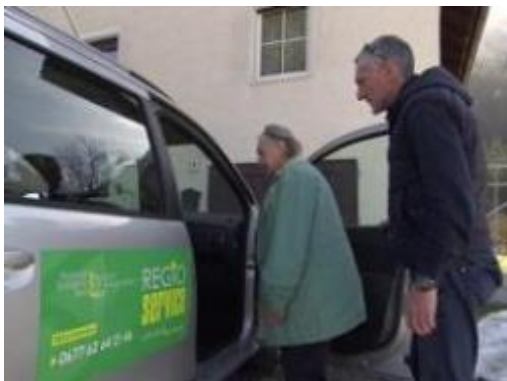
Slika: Dobro leto v občinah Borovlje, Sele in Šmarjeta v Rožu že obratuje socialni osebni prevozni servis REGIOtaksi, ki je nastal na pobudo Volilne skupnosti (VS) iz Borovelj.