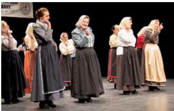
Slika: Nastop Folklorne skupine upokojenk ZSM na festivalu.

Kulturnemu društvu Brdo Kranj se zahvaljujemo za povabilo in upamo, da bomo tudi v prihodnje ohranjali dobre stike in sodelovanje.