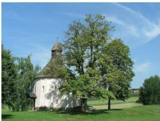
Slika: Rotunda v Selu.