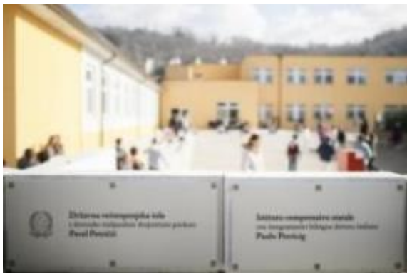
Slika: Državna večstopenjska šola s slovensko-italijanskim dvojezičnim poukom Pavel Petričič v Špetru trenutno gosti 285 otrok.

Po podatkih italijanskega statističnega urada je začetek lanskega leta v Reziji, Terski in Nadiških dolinah dočakalo 7556 ljudi s povprečno starostjo krepko čez 50 let. Koliko od teh je (še) Slovencev, nihče ne ve več točno. Zadnji etnični popis je Italija izvedla leta 1971, odtlej pa se Slovencev ne prešteva več. Politični pritisk in odkrito protislovenstvo sta zatrla slovensko identiteto tudi to te mere, da so se mnogi identificirali z »agresorjem«, je neposreden Ruttar: »Mnogi so postali bolj Italijani, kot Italijani sami.«