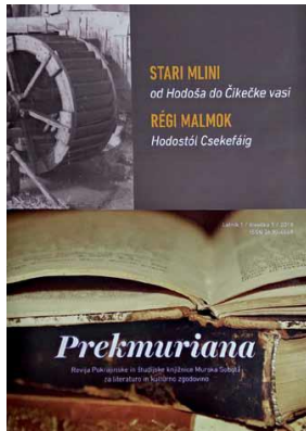
Slika: Stari mlini in Prekmuriana: Foto: Ernest Ružič

V Pokrajinski in študijski knjižnici so predstavili tri publikacije: Fajn je bilou – zgodbe iz življenja Porabk in Porabcev, o kateri sem pisal, Stari mlini – od Hodoša do Čikečke vasi (v slovenskem in madžarskem jeziku) in Prekmuriana – revija Pokrajinske in študijske knjižnice za literaturo in kulturno zgodovino, ki bo izhajala enkrat ali dvakrat letno.