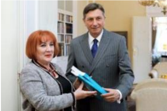
Slika: Varuhinja je predsedniku Pahorju predala še svoje zadnje letno poročilo.

človekovih pravic in v vlogi varuha bom vsak dan to ogledalo," je dodal. Zagotovil je, da bo brezkompromisno opozarjal na kršitve in odločno predlagal rešitve.