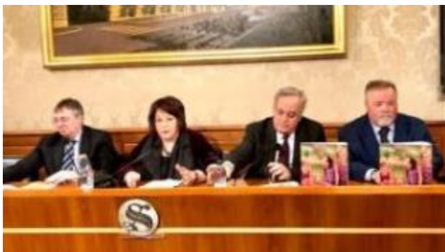
Slika: Z leve Walter Bandelj, Tatjana Rojc, senator Gianclaudio Bressa in Rudi Pavšič v dvorani Nassirya v italijanskem senatu. Foto: AW

https://www.primorski.eu/se/casellatijeva-pokazala-razumevanje-XA211033