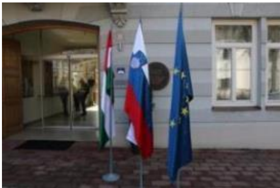
Slika: Sožitje v narodnostno mešani Lendavi občasno zmotijo zdrahe.

Horvath naj bi se iz moralnih razlogov odpovedal eni od funkcij