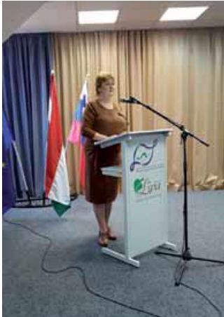
Slika: Slovenska zagovornica pri Porabskem slovenskem društvu upokojencev.