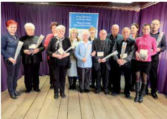
Slika: Vsi, steri so avtorici pripovejdali.