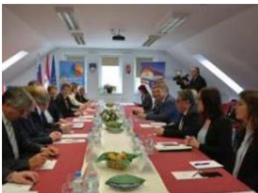
Slika: Predsednika sta se sicer najprej srečala s predstavniki madžarske narodne skupnosti v mestni hiši v in centru Banffy v Lendavi, zatem pa na sedežu Državne slovenske samouprave na Gornjem Seniku s predstavniki avtohtone slovenske narodne skupnosti na Madžarskem.

Predsednika sta se sicer najprej srečala s predstavniki madžarske narodne skupnosti v mestni hiši v in centru Banffy v Lendavi, zatem pa na sedežu Državne slovenske samouprave na Gornjem Seniku s predstavniki avtohtone slovenske narodne skupnosti na Madžarskem. Obiskala sta dvojezično osnovno šolo Gornji Senik in imela delovno srečanje za zaprtimi vrati v Slovenskem kulturnem centru Lipa v Monoštru.