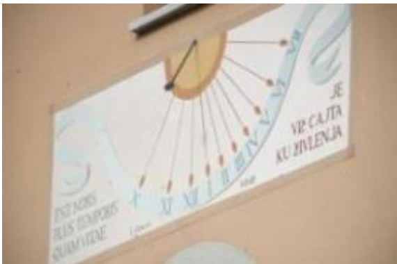
Slika: Napis na sončni uri na občinski stavbi pove največ.

Statistični demografski podatki v Reziji, Terski dolini in Benečiji so zastrašujoči: Prebivalstvo se je v slabih stotih letih zmanjšalo za 73,2 odstotka. Prvi popis je takratna kraljevina opravila leta 1871, nekaj let po plebiscitu, ko so se prebivalci odločili za priključitev Italiji namesto Avstro-Ogrski, čeprav so se s tem prebivalci ločili od nacionalnih bratov in sester. Takrat je na omenjenem prostoru živel 22.490 prebivalcev. Etnični popis, ki je vključeval tudi jezikovno mešane občine ob meji, je izluščil, da je na tem območju tedaj živel 35.000 Slovencev.