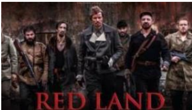
Slika: Unija Italijanov bo drevi in v soboto v izolskem kinu Odeon predvajala film Red Land (Rosso Istria).