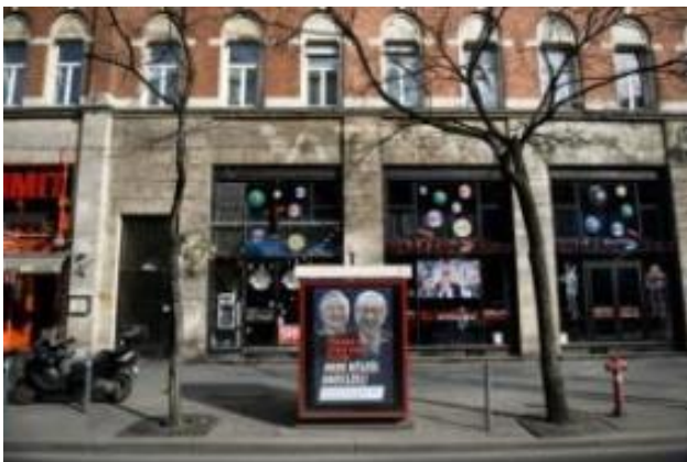
Slika: Plakat v središču Budimpešte, na katerem sta predsednik Evropske komisije Jean-Claude Juncker in ameriško-madžarski milijarder George Soros. Vlada Viktorja Orbana je Junckerja "obtožila", da želi ob podpori Sorosa evropskim državam vsiliti prebežnike iz tretjih držav, predvsem iz muslimanskega sveta in Afrike.

V odzivu na trditve, da želi Bruselj uvesti obvezne kvote za preseljevanje beguncev iz tretjih držav, v Bruslju pojasnjujejo, da je shema preseljevanja vselej bila in bo vselej ostala prostovoljna. Ob tem so opozorili na razliko med preseljevanjem beguncev iz tretjih držav v EU in premeščanjem beguncev znotraj EU-ja. Medtem ko je preseljevanje vselej potekalo na prostovoljni osnovi, pa so članice uvedle obvezne kvote za premeščanje beguncev znotraj EU-ja.