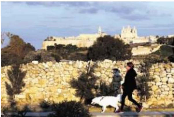
Slika: Fotografija je simbolična.

Evropa, skorajda neprodušna trdnjava za begunce, ki nimajo ničesar, je čedalje bolj porozna za begunce, ki imajo vse. Razen morda dokazil, da je njihovo premoženje legalno pridobljeno. Članice EU, ki prodajajo bodisi državljanstva bodisi bivalne vizume, z obetom državljanstva po določenem obdobju, je iz leta v leto več. Cena? Malenkost, vsaj za kitajske in indijske tajkune, ruske oligarhe, arabske šejke in brazilске magnate: v povprečju manj kot milijon evrov in morda še nekaj malega pristojbin.