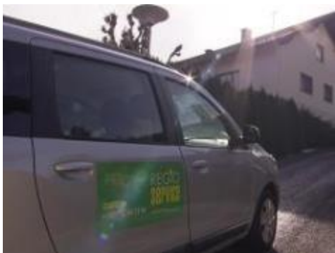
Slika: Čeprav je prihodnost glede sofinanciranja s strani javne roke odprta, se je projekt REGIOtaksi v občinah Borovlje, Sele in Šmarjeta v Rožu uveljavil.

Čeprav je prihodnost glede sofinanciranja s strani javne roke odprta, se je projekt REGIOtaksi v občinah Borovlje, Sele in Šmarjeta v Rožu uveljavil.