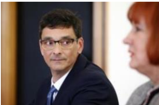
Slika: »Pravičnost za vse prebivalke in prebivalce ni floskula, ampak temeljno vodilo, ki mu bom sledil pri svojem delu na mestu varuha,« je napovedal novi varuh človekovih pravic.