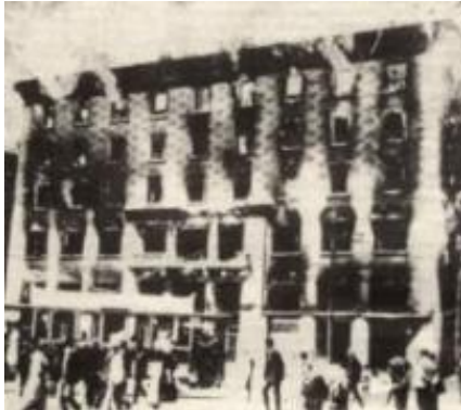
Slika: Narodni dom v Trstu ob požigu leta 1920.

Stopnjevanje političnih napetosti na dveh mejah kaže, kako živ je nacionalizem v Italiji. S Francijo je uprizorila diplomatsko krizo brez precedensa, s Slovenijo in Hrvaško je oživila zgodovinski revizionizem. Pomemben je širši kontekst zaostrovanja: v vsej Evropi je na pohodu desnica, odkar je v Rimu na oblasti populistično-nacionalistična vlada, se je razpoloženje v sosednji državi spremenilo. Italija se je preoblikovala skoraj do neprepoznavnosti.