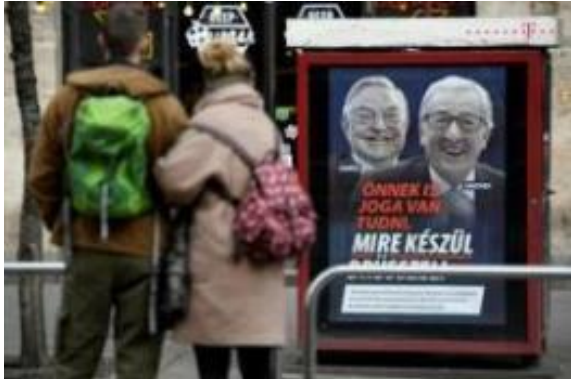
Slika: Madžarska kampanja proti Junckerju je videti kot kaplja čez rob. V EPP je čedalje več nezadovoljstva z ravnanjem madžarskega premiera.

Bruselj – V Evropski ljudski stranki (EPP) se je zgodil premik v odnosu do madžarskega premiera Viktorja Orbána in njegovega Fidesza. Začetek plakatne kampanje, v kateri je ob milijarderju Georgeu Sorosu tarča napadov predsednik evropske komisije Jean-Claude Juncker , je izbil sodu dno.