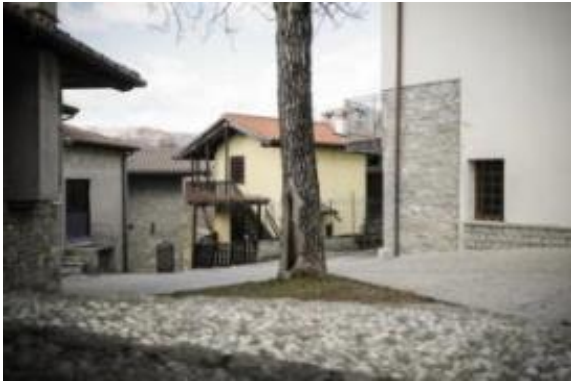
Slika: Vas Gorenji Tarbij v Benečiji ima veliko na novo obnovljenih hiš, toda manj stalnih prebivalcev.

Le redkokatera hiša se v občini sesuva sama vase, prej nasprotno. Gorenji Tarbij je nadvse všečna vas z veliko na novo obnovljenimi hišami v sijočem beneškem arhitekturnem stilu, vendar pa vsaka hiša nima stalnega prebivalca. Nastajajo tudi nove turistične nastanitve. Z denarjem Videmske pokrajine trenutno na veliko krčijo gozdove, ki so prej malodane prodrli v dnevne sobe. Pognali so tudi projekt združevanja parcel, ki so jih ponekod tako drobili, da je lahko na nekaj hektarjih 40 lastnikov.