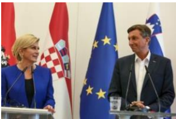
Slika: Fotografija je simbolična.

Dogovorila sta se o nekaterih vprašanih glede naslednjega srečanja voditeljev držav procesa Brdo Brioni, ki ga skupaj vodita. Soglašala sta, da je v sedanjih razmerah v mednarodnem okolju še posebej pomembno ohraniti dobre sosedske odnose in reden dialog med državami na najvišji politični ravni, so navedli.