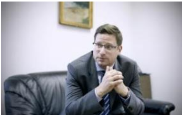
Slika: Združeno kraljestvo zapušča EU, migracijska problematika je katastrofa za evropsko komisijo; z zgodovinske perspektive je to za EU neuspešno obdobje, je prepričan Gergely Gulyás.

Gergely Gulyás, vodja urada premiera Orbána: Madžari hočemo sami sprejemati svoje odločitve