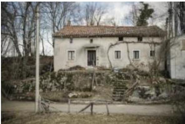
Slika: Zaselek Klinac je že dolgo brez stalnega prebivalca.

Največ prebivalstva je v desetih obmejnih občinah živel leta 1921, in sicer 28.126. Razen redkih laških uradniških izjem na tem območju lahko govorimo o slovenskih občinah. Do konca druge svetovne vojne se je število prebivalcev nenehno zmanjševalo za dobro desetino, pravi mrk pa so doline doživele v mračnem obdobju Benečije med letoma 1951 in 1971, ko so zgodovinske razmere prebivalstvo zdesetkale za dobrih 40 odstotkov oziroma za dobrih 10.000 prebivalcev.