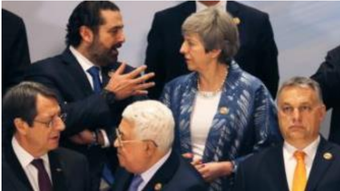
Slika: Pogovor britanske premierke Therese May in libanonskega premierja Saada Haririja.

https://www.rtvslo.si/evropska-unija/na-vrhu-eu-ja-in-arabske-lige-pozivi-k-sosedskemu-sodelovanju/481013