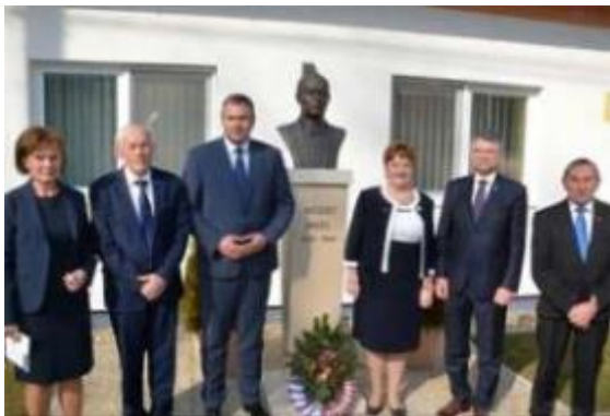
Slika: Predsednik slovenskega državnega zbora Dejan Židan je z madžarskim kolegom Laszлом Köverjem obiskal Prekmurje in Porabje

„Kakor sta bili za obstoj in razvoj slovenske skupnosti v Porabju pomembna dva trenutka, ustanovitev Državne slovenske samouprave in Razvojne agencije Slovenska krajina, smo pred tretjim trenutkom, ki je vsaj enako pomemben. Zanj smo Madžarski hvaležni, saj je naša skupnost tukaj najmanjša, projekt pa uresničuje za manjšino bistvene stvari,“ je povedal Židan. Pohvalil je tudi boljšo organiziranost porabskih Slovencev, ki je po njegovem prinesla viden napredek in uspešne projekte, ki poleg jezika in kulture utrjujejo tudi gospodarsko moč narodne skupnosti, kar je, tako Židan, najpomembnejši pogoj, da kot skupnost ostanejo tudi v prihodnje.