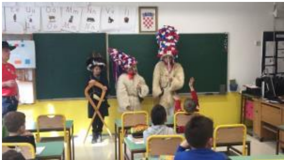
Slika: Podmladek škorumatov na OŠ Kozala.

Pustne šeme z Bistriškega se pogosto udeležujejo karnevalskih dogodkov na Reki in okolici, podgrajski škorumati pa so posebej znani gostje v Kastvu in Matuljih, kjer so več let sodelovali na reviji zvončarjev. Tokrat so na Reki, na osnovni šoli Kozala, predstavili tri člane svojega podmladka.