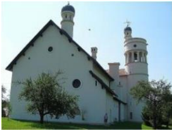
Slika: Plečnikova cerkev v Bogojini.

Med spomeniki moram omeniti Rotundo v Selu, Cerkev Gospodovega Vnebohoda v Bogojini, Cerkev sv. Martina v Martjancih; na področju naselbinske dediščine je to vas Filovci in na področju književne zapuščine Martjanska pesmarica. Glede naravne dediščine so posebej pomembni Ratkovski potok in potok Curek (mokrotni travniki) ter gozd v Motvarjevcih. Neprecenljiva naravna danost so vrelni termo-mineralne vode v Moravskih Toplicah.ž