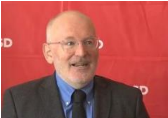
Slika: Frans Timmermans.

In kako se bo lahko EU širila v tem delu Evrope, kako bomo lahko kdaj koli to storili, če ne moremo rešiti niti notranjega mejnega spora, ko vidimo kakšni mejni spori ostajajo v drugih delih Balkana."