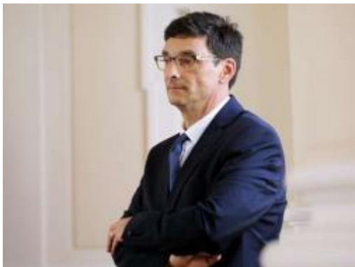
Slika: Peter Svetina.

Novi varuh človekovih pravic je bil navzoč tudi pri predaji letnega poročila varuha pri predsedniku Republike Slovenije, kjer je prav tako poudaril pomen spoštovanja človekovih pravic za vse. „Pravičnost za vse prebivalke in prebivalce ni floskula, ampak temeljno vodilo, ki mu bom sledil pri svojem delu na mestu varuha,“ je napovedal. „Ogledalo družbe je spoštovanje človekovih pravic in v vlogi varuha bom vsak dan to ogledalo,“ je dodal. Zagotovil je, da bo brezkompromisno opozarjal na kršitve in odločno predlagal rešitve.