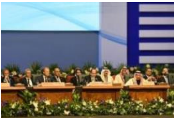
Slika: Predsednik Evropskega sveta Donald Tusk in egiptovski predsednik Abdel Fatah al Sisi

Gostitelj vrha, egiptovski predsednik Abdel Fatah al Sisi, je v uvodnem nagovoru Evropsko unijo pozval k okrepitvi skupnega boja proti terorizmu.