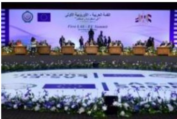
Slika: Prvič v zgodovini so skupaj sedli voditelji članic Evropske unije in Arabske lige.

Prvič v zgodovini so skupaj sedli voditelji članic Evropske unije in Arabske lige. V Egiptu bodo govorili o migracijah, varnosti, regijskih in globalnih vprašanjih ter ekonomiji, konkretnjših rezultatov pa ne pričakujejo.