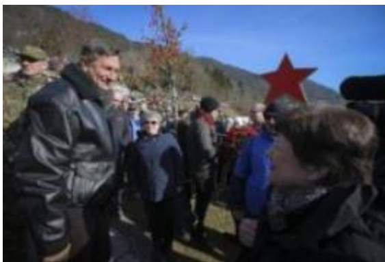
Slika: Ideja predsednika Boruta Pahorja o skupnih učbenikih, iz katerih bi se zgodovine učila mladež z levega in desnega brega Soče, je pobožna želja, realna približno tako kot prepričanje, da sonce danes ne bo zašlo.

Italijani na Slovence od nekdanj gledajo zviška, za spravo po francosko-nemškem zgledu pa se morata obe strani počutiti vsaj približno enakopravni.