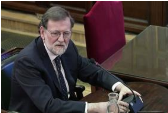
Slika: Mariano Rajoy na sodišču v Madridu.

Na sojenju nekdanjim katalonskim voditeljem zaradi njihove vloge v poskusu odcepitve Katalonije od Španije so danes v Madridu zaslišali nekdanjega španskega premierja Mariana Rajoya. Zagovornike neodvisnosti je obtožil, da so želeli z referendumom o neodvisnosti leta 2017 "likvidirati nacionalno suverenost".