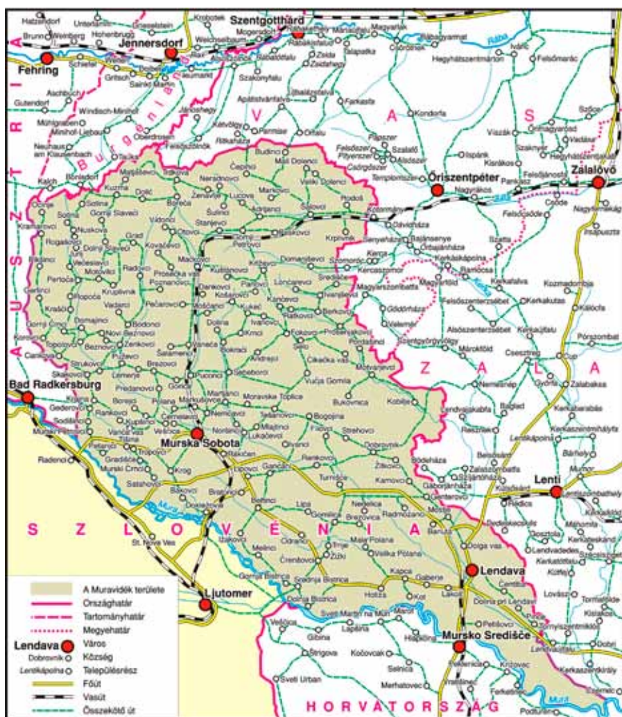
A Muravidék napjainkban